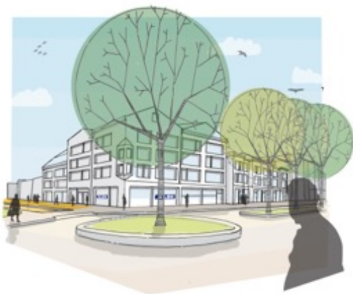
Supermarkt en woningen op de hoek van de Thamerlaan

Er komt een supermarkt (discounter) op de hoek van de Thamerlaan en de Prinses Irenelaan. Naar het zich nu laat aanzien wordt dit de Aldi die verhuist van de huidige (tijdelijke) locatie bij het Connexion terrein (Kootpark-Oost). Dit gebied is een toekomstige woningbouwlocatie. De klanten voor de nieuwe supermarkt parkeren op het grote parkeerterrein op het binnenterrein waar ook andere bezoekers welkom zijn. Op de supermarkt komen appartementen.