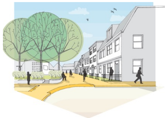
Woningen aan de Prinses Irenelaan en uitbreiding van het Oranjepark

Op het Amstelplein, tegenover het gemeentehuis, komt een aantal woningen met de mogelijkheid voor dienstverlening of detailhandel op de begane grond. Deze bebouwing heeft als doel het huidige plein beter vorm te geven waardoor er meer beschutting en een prettigere ruimte ontstaan.